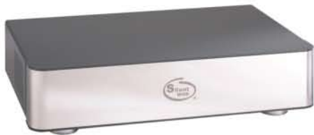
Premium 版本電源處理器 (5位和8位供選擇)

尺 寸: 90mm高 X 435mm寬 X 290mm深 - (5位) 126mm高 X 435mm寬 X 290mm深 - (8位)