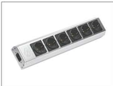
Reference mk3 電源插座