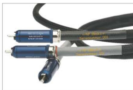
NF 38mk3 Interconnects