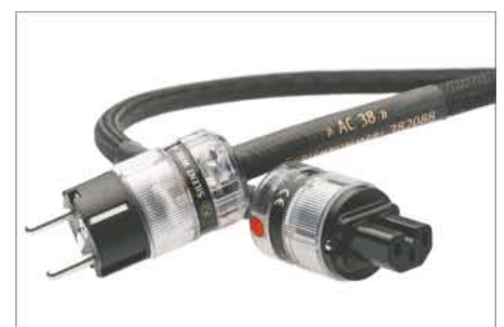
AC38 Power Cord