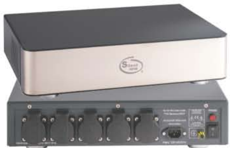
Basic 版本電源處理器 (5位和8位供選擇)

尺 寸: 90mm高 X 435mm寬 X 290mm深 - (5位) 126mm高 X 435mm寬 X 290mm深 - (8位)