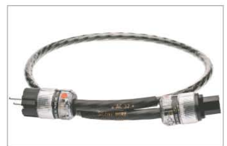
AC32 Power Cord