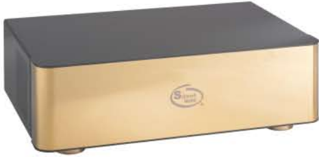
Hi-End 版本電源處理器 (5位和8位供選擇)

Silent(西倫斯)電源處理器(適用於訊源、前級、后級)為您的系統帶來一個最頂級性能的超低噪聲、高電流能力的處理,為執着的狂熱音樂愛好者提供更毫不妥協的選擇。