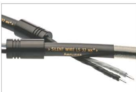
LS 32mk2 Speaker Cable