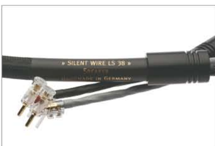
LS 38 Speaker Cable